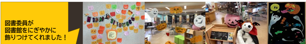
図書委員が 図書館をにぎやかに 飾りつけてくれました!